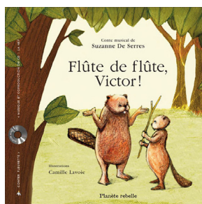
Flûte de flûte, Victor !

15 avril 2012, 14 h , Maison de la culture Côte-des-Neiges (5290, chemin de la Côte-des-Neiges)